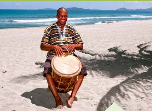
Músico garífuna con su tambor